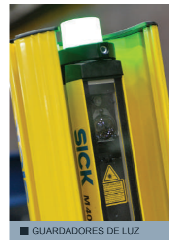
■ GUARDADORES DE LUZ