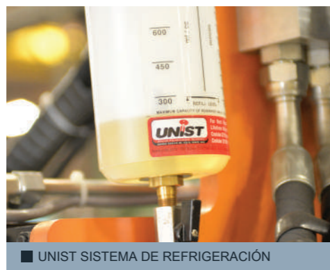
■ UNIST SISTEMA DE REFRIGERACIÓN