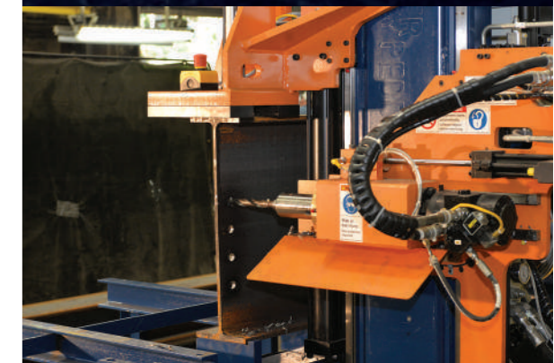
■ MOTOR DE HUSILLO HIDRÁULICO