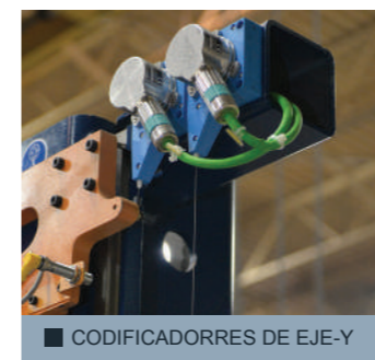
■ CODIFICADORES DE EJE-Y

Desde que se introdujo el Ocean Avenger, cientos de fabricantes de acero estructural han disfrutado de los beneficios de la producción automatizada: costos de mano de obra más bajos, capacidad aumentada y mejor calidad.