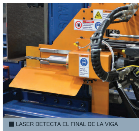
■ LASER DETECTA EL FINAL DE LA VIGA