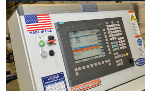
■ PANEL DE CONTROL DE USO SENCILLO